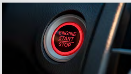
Botão de Partida do Motor (Start/Stop).