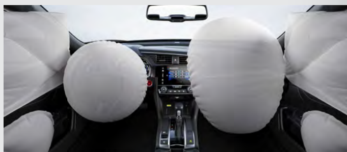
6 Airbags (2 frontais, 2 laterais e 2 de cortina).

Projetado para o seu conforto, o Honda Civic possui câmbio de transmissão automática do tipo CVT (Continuamente Variável) e, a partir da versão Sport , Paddle Shift de 7 velocidades que combinados proporcionam uma condução suave, com respostas mais precisas e aceleração linear.