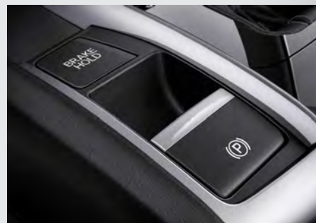
Freio de Estacionamento Eletrônico (EPB) com Função Brake Hold.