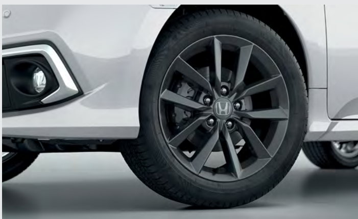
Rodas de Liga Leve.