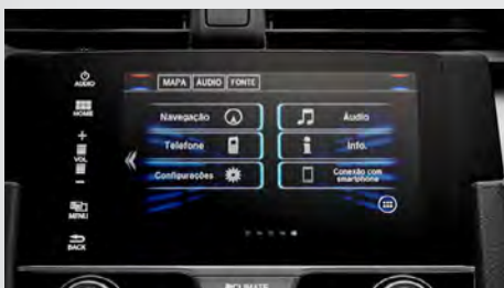
Multimídia de 7" com Navegador, Interface para Smartphone.

Nas versões EXL e Touring , a Central Multimídia ainda agrega navegador GPS . E, para seu total conforto, a versão Touring ainda possui carregador por indução (wireless) no console central. Basta apoiar o seu smartphone 2 e, sem a necessidade de nenhum fio, o aparelho passa a ser carregado.