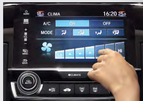
Ar-Condicionado Digital com Função Dual Zone.

A partir da versão EX o modelo já conta com retrovisor interno eletrocromático (antiofuscamento) . As versões EXL e Touring agregam sensor de chuva para acionamento automático dos limpadores de para-brisa e chave Smart Key . A versão Touring adiciona partida no motor a distância, para-brisa com isolamento acústico e o banco do motorista com ajuste lombar e regulagens elétricas para maior conforto.