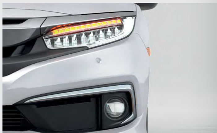
Faróis Full LED.