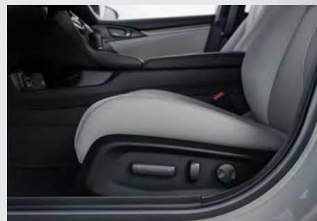
Banco do motorista com ajuste lombar e regulagens elétricas.