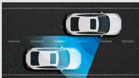
Exclusivo Sistema Honda LaneWatch™.

O conjunto de suspensões é um grande diferencial para quem procura performance e estabilidade ao dirigir. Além das Suspensões Dianteiras MacPherson com barras estabilizadoras, o Honda Civic vem de série com Suspensão Traseira Multi-Link também com barras estabilizadoras que garantem conforto diferenciado e dirigibilidade excepcional.